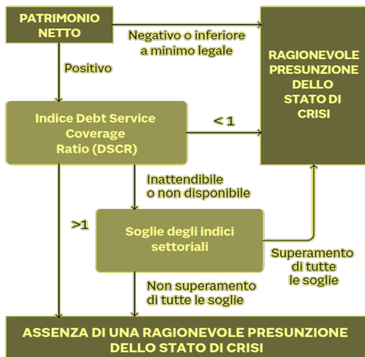
SISTEMA DEGLI INDICI DI CUI ALLA DELEGA ART. 13. C. 2 (PARTE 1)